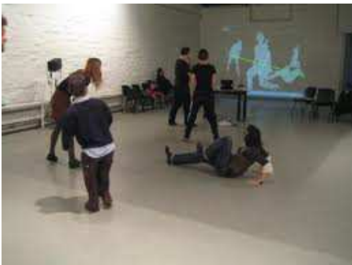
(imágen de taller sobre Whatever Dance Toolbox )